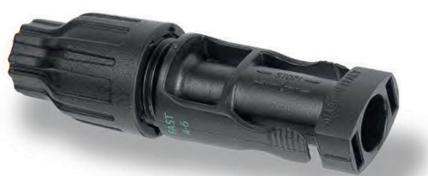
"Male" savienotājs – kabelis Ø 4-6 mm 2