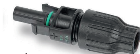
"Female" savienotājs – kabelis Ø 4-6 mm 2